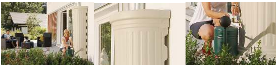
Lietaus vandens kolona wall stone grey (550L):